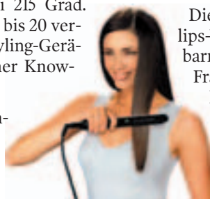
Haarglätter - entwickelt bei Philips in Klagenfurt

ser Idee: Auch Männer wollen gepflegt wirken und finden sich mit getrimmter oder glatt rasierter Brust sexier, als mit zerzauster „Wolle“.