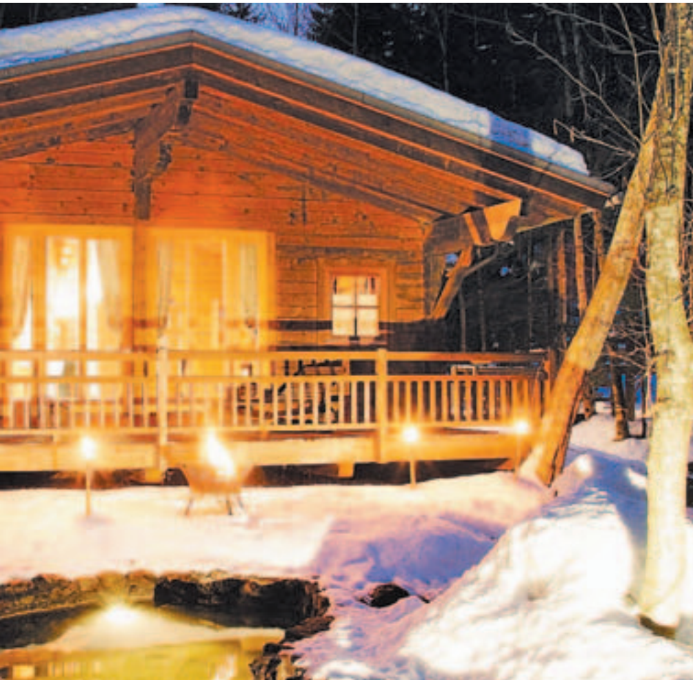
Saunahütte mitten im Wald mit Privatbach - so fühlt sich Wohlfühlen im Biohotel Dabe- rer im Gailtal an