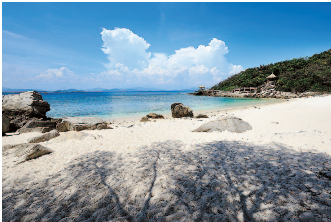
IN RIVA AL MARE Spiagge naturali, acqua di un profondo blu, pagode come palafitte

A 90 km dalla costa si è in piena foresta pluviale, un album botanico vivente. Come fondale il Monte delle 7 Fate, cime sfumate in una nebbia fluttuante. Il Resort & Spa Narada ( www.hainanparadise.com ) è immerso nella vegetazione tra i suoni conosciuti e non di uccelli e altri animali. Sparsa su numerosi ettari, si compone di un corpo centrale con un ristorante arioso, spa e vasche con acqua termale, piscine a sfioro sulla valle, cottage su palafitte. Nel vicino, affollato parco di Yanoda si scopre ogni varietà botanica lungo sentieri precostituiti. Passato, presente e futuro si mescolano: c'è tutta l'anima della grande civiltà cinese ad Hainan con il volto puntato sul Terzo Millennio. ( www.turismocinese.it ; pacchetti Cathay Holidays Italia: www.cxholidays.com ; voli Cathay Pacific giornalieri da Mi, 5 settimanali da Roma: a/r da 900 euro in Economy, da 3000 in Business, decretata la migliore del mondo: www.cathaypacific.it ).