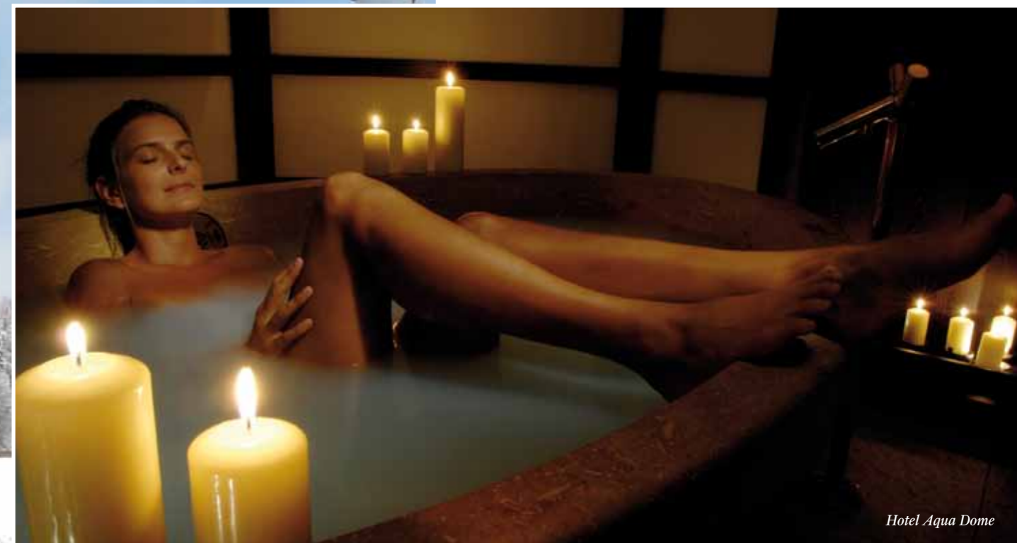
Hotel Aqua Dome

DOPO UNA GIORNATA TRASCORSA SUGLI SCI O CON LE CIASPOLE AI PIEDI, È D'OBBLIGO UN "PIT STOP" ALLA SPA, PER DARE COMFORT ALLE NOSTRE ESTREMITÀ, MESSE A DURA PROVA DA TEMPERATURE DA BRIVIDO!