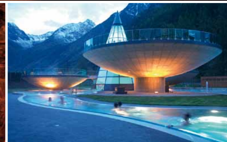
Hotel Aqua Dome