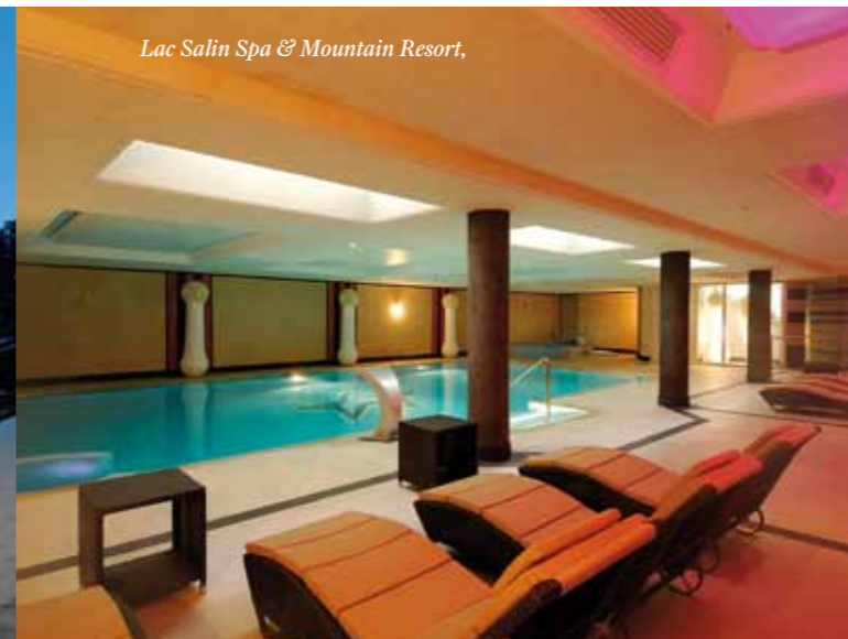
Lac Salin Spa & Mountain Resort,