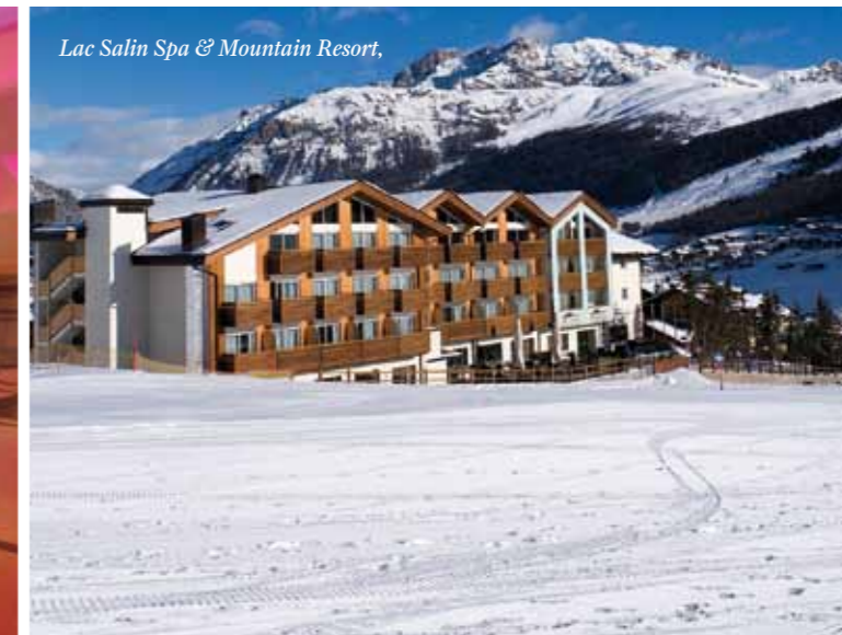
Lac Salin Spa & Mountain Resort,