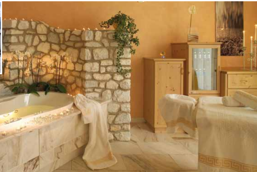
Excelsior Mountain Style Spa Resort